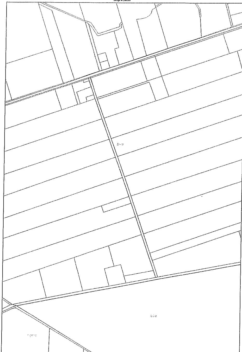
Wydruk mapy z systemu WebEWID Droga w Działce