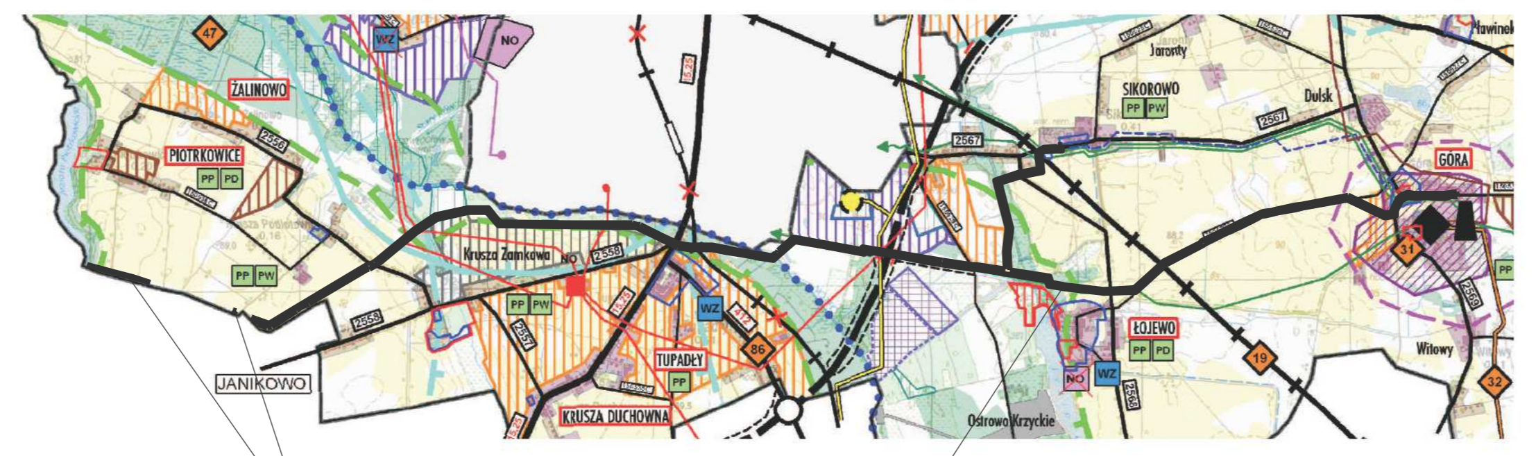
TEREN OBJĘTY MIEJSCOWYM PLANEM ZAGOSPODAROWANIA PRZESTRZENNEGO