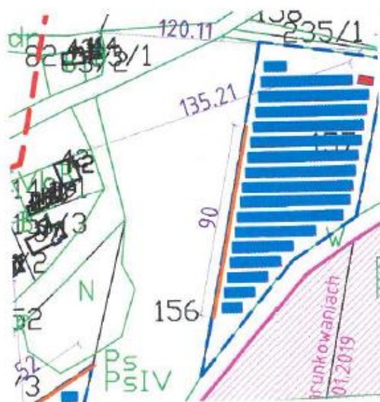
Rys. 3 Zieleń izolująca (ciągła linia) wzdłuż działki 157.