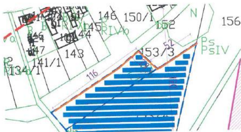
Rys. 2 Zieleń izolująca (ciągła linia) wzdłuż działek 153/3 i 153/4.