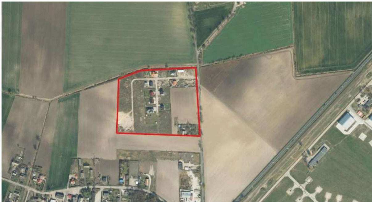
Charakter zagospodarowania analizowanego terenu

Analizowany obszar obejmuje swym zasięgiem teren o powierzchni około 5,3 ha z zabudową mieszkaniową jednorodzinną, położony przy drodze wojewódzkiej nr 400, w odległości około 230 m na zachód od drogi krajowej oraz lotniska Inowrocław – Latkowo oraz bazy lotnictwa wojskowego.