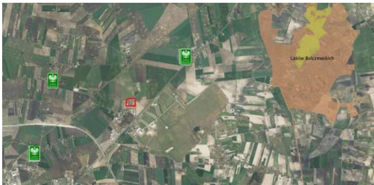
Analizowany teren na tle mapy obszarów chronionych

Przez teren nie przebiega żaden z wyznaczonych przez IBS PAN korytarzy ekologicznych. Warto zwrócić uwagę, iż teren opracowania znajduje się w sąsiedztwie rowu – cieku wodnego, który stanowić może potencjalny lokalny korytarz ekologiczny ze względu na roślinność występującą na brzegach.