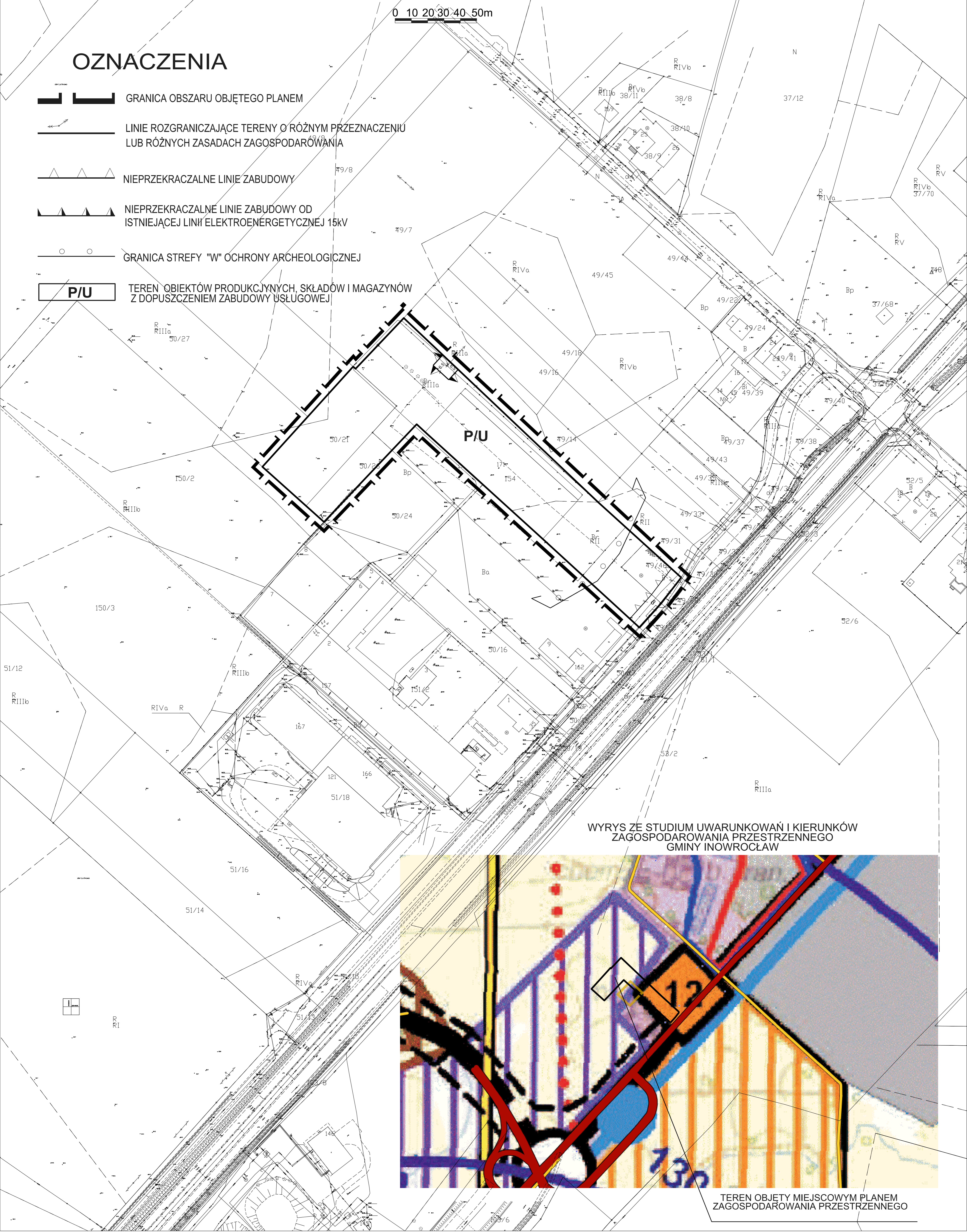
WYRYS ZE STUDIUM UWARUNKOWAŃ I KIERUNKÓW ZAGOSPODAROWANIA PRZESTRZENNEGO GMINY INOWROCLAW