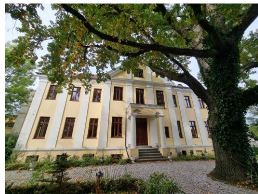
Fotografia 9. Widok na dwór w Łojewie.

Dwór wzniesiono na przełomie XIX i XX w., rozbudowano w latach 70. XX w., na skarpie opadającej ku brzegom jeziora Małe Gopła. Dwór neoklasycystyczny, piętrowy, nakryty dachem czterospadowym. Elewacje rozczłonkowane pilastrami w tak zwanym wielkim porządku, zwieńczone bogato profilowanym gzymsem podokapowym. Fasada zaakcentowana ryzalitem środkowym, zwieńczonym trójkątnym, szczytem i poprzedzonym portykiem ujętym parą doryckich kolumn, dźwigających płytę tarasu. Zabudowania gospodarcze, w tym rządcówka i gołębnik, z przełomu XIX i XX w. stanie dobrym; ogrodzenie do konserwacji. Założenie dworsko-parkowe wpisano do rejestru zabytków pod nr.: A/1434 z 15.01.1985 r.