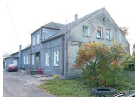
Fotografia 13. Widok na dwór w Borkowie.

Budynek wskazany do remontu konserwatorskiego z odtworzeniem pierwotnego stanu elewacji, podziałów, detalu architektonicznego, stolarki i ceramicznego pokrycia dachu (usunięcie eternitu).