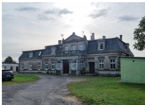
Fotografia 17. Widok na dwór w Komaszycach.

Budynek wskazany do remontu konserwatorskiego (szczególnie elewacja) z wymianą i odtworzeniem pierwotnej stolarki. Budynek objęty ochroną poprzez wpis do wojewódzkiej ewidencji zabytków.