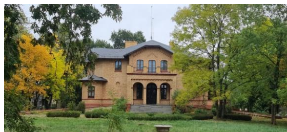
Fotografia 11. Widok na Dwór w Orłowie.

Wzniesiony z cegły licówki, z ryzalitami we wszystkich elewacjach i piętrową facjatką, balkonem oraz arkadowym gankiem. Wejścia znajdują się w ryzalitach z trzech stron. Dwór na lekkim wzniesieniu poprzedzony brukowanym, kolistym podjazdem. W otoczeniu dworu park z 2. połowy XIX w. o powierzchni 2,66 ha. Zespół dworski wpisano do rejestru zabytków pod nr.: A/182 z 9.06.2004 r. Obiekt znajduje się w rękach prywatnych. Zespół w dobrym stanie zachowania.