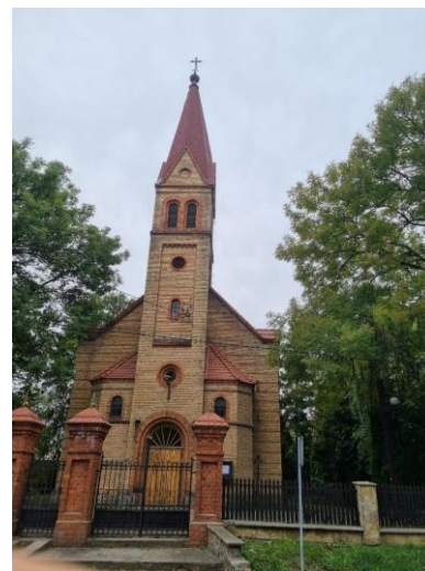
Fotografia 2. Widok na kościół pw. św. Elżbiety.

Parafię utworzono i uposażono z inicjatywy krzyżackiej na przełomie w XIV i XV . Pierwszy kościół został zbudowany z drewna. Obecny ceglany kościół św. Elżbiety wzniesiono około 1858 r. w stylu historyzmu z elementami neoromańskimi i neogotyckimi. Jest to obiekt nieorientowany, frontem zwrócony w stronę drogi ku wschodowi. Jednonawową bryłę poprzedza wysoka wieża, zwieńczona wielobocznym hełmem, mieszcząca w przyziemiu półkolistą arkadę wejścia do kruchty, flankowaną aneksami. Od zachodu znajduje się niższe, trójbocznie zamknięte, oszkarpowane prezbiterium z zakrystią od południa. Kościół, posadowiony na kamienno-ceglanym fundamencie, wymurowano z żółtej cegły ceramicznej, licówki z pasami poprzecznych fryzów z cegły czerwonej (zendrówki). Otwory okienne zamknięte półkoliście w opaskach z czerwonej cegły, w nawie i prezbiterium w układzie biforyjnym z oculusem. Dachy kryte dachówką ceramiczną, karpiówką w koronkę. Wokół kościoła ogrodzenie z żeliwną bramą i furtka wpięta w dekoracyjne, masywne, ceglane słupy. Naprzeciw kościoła cmentarz parafialny. Stan zachowania kościoła dobry Stan techniczny obiektu – dobry.