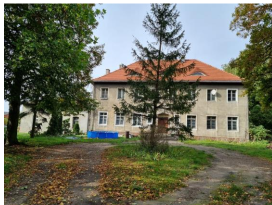
Fotografia 10. Widok na pałac w Marulewach.

Pałac datowany na lata 30. XX w., położony jest na terenie dawnego założenia dworsko-ogrodowego. Klasyczny i harmonijny w formie pałac jest masywną, piętrową budowlą, założoną na planie regularnego prostokąta, nakrytą czterospadowym dachem, w którym od frontu trzy okna w typie wolego oka. Bryła uzupełniona od północy mieszkalną przybudówką z gospodarczym poddaszem. W elewacjach