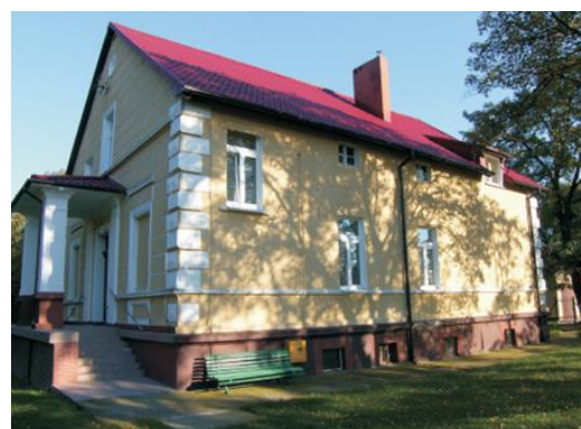
Fotografia 23. Widok na dwór w Sławęcinku.

Zbudowany na początku XX w. dla niemieckiej rodziny Kohnertów. Parterowy budynek z mieszkalnym poddaszem i ryzalitem od strony parku, zwieńczonym trójkątnym tympanonem. Ściany bogato dekorowane z podziałami architektonicznymi, opięte dekoracyjnym boniowaniem z pilastrami i kartuszem w naczółku ryzalitu. Po 1945 upaństwowiony, obecnie stanowi własność prywatną. Park z początku XX o powierzchni 0,64 ha z zachowanymi alejkami.