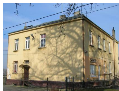
Fotografia 18. Widok na dwór w Kruszy Podlotowej.

Stan techniczny obiektu – dostateczny. Budynek objęty ochroną poprzez wpis do wojewódzkiej ewidencji zabytków.