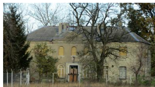
Fotografia 14. Widok na dwór w Górze.

Na wschód od dworu znajduje się park z 2. połowy XIX w. o powierzchni około 1 ha. Budynek wskazany do remontu konserwatorskiego z odtworzeniem pierwotnego stanu elewacji.