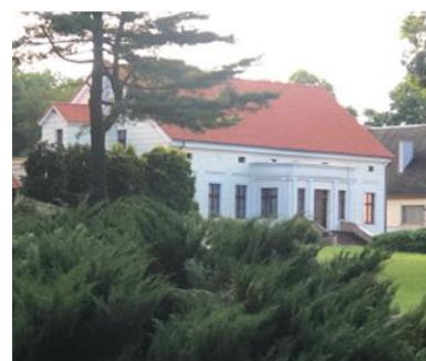
Fotografia 3. Widok na dwór w Cieślinie.

Dwór wzniesiono w 1864 r. dla Franciszka Brzeskiego, rozbudowano w końcu XIX w. Dwór parterowy z mieszkalnym poddaszem, podpiwniczony, na rzucie prostokąta, kryty dachem dwuspadowym (dachówka), o boniowanych elewacjach, zaakcentowanych gzymsami i skromnym detalem architektonicznym. Na osi murowana weranda o ściankach ujętych parami półkolumn, poprzedzona schodami. Nad wejściem do dworu herb „Prawdzie” (Brzeskich). Z boku dworu znajduje się parterowa przybudówka z końca XIX w. Dwór otacza zadbane park krajobrazowy z XIX w. o powierzchni 4,6 ha. Założenie wpisano do rejestru zabytków pod nr.: A/1454 z 26.04.1984 r. Obiekt znajduje się w rękach prywatnych. Stan zachowania dworu i parku - bardzo dobry.