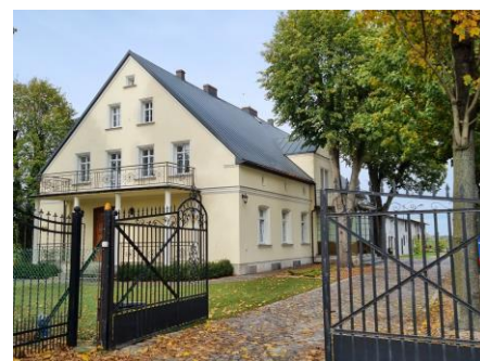
Fotografia 15. Widok na dwór w Jacewie.

Wzniesiony w końcu XIX w. dla niemieckiej rodziny Rath. Parterowy, kryty dachem mansardowym z przeszkloną werandą, nad którą taras z żeliwną balustradą. Wystawka zwieńczona trójkątnym tympanonem. Elewacje pozbawione podziałów i pierwotnej oprawy architektonicznej. Wokół budynki dawnego zespołu dworskiego (rządcówka, spichlerz, młyn) i park o powierzchni około 0,5 ha z końca XIX w. Dwór wyremontowany w ostatnich latach. Obiekt znajduje się w rękach prywatnych. Budynek objęty ochroną poprzez wpis do wojewódzkiej ewidencji zabytków.