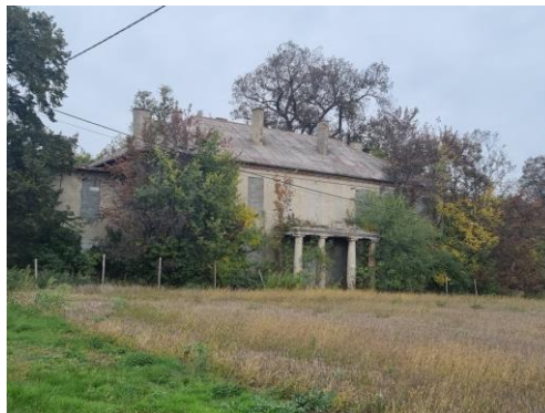
Fotografia 4. Widok na dwór w Czystem.

Dwór powstał około połowy XIX w. z wykorzystaniem fragmentów wcześniejszego budynku; rozbudowano go w 1929 r. według projektu Polikarpa Łuczaka z Pakości. Dwór, mocno zdegradowany, o reliktowo zachowanych cechach klasycystycznych, piętrowy, na planie prostokąta, kryty czterospadowym dachem (eternit). Od frontu, kolumnowy, obecnie mocno zdegradowany portyk z czterema masywnymi kolumnami podtrzymującymi relikty balkonu. W elewacji tylnej znajduje się pięcioboczna weranda, a od zachodu klatka