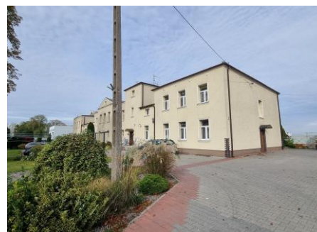
Fotografia 22. Widok na dwór w Sikorowie.

Stan techniczny obiektu – dobry. Sugerowane prace konserwatorskie budynku z odtworzeniem pierwotnego stanu elewacji arkadowym portykiem i detalem architektonicznym oraz rewitalizacja parku.