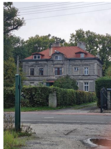
Fotografia 6. Widok na pałac w Kłopotcie.

Pałac wzniesiony w 2. połowie XIX w., obecnie zamieszkały przez lokatorów. Pałac w swym charakterze nawiązuje do podmiejskich willi: piętrowy o bogatej artykulacji ścian, z detalem i podziałami architektonicznymi, wzbogacony w elewacji frontowej ryzalitem, wykuszem i wystawkami, przykryty dachem czterospadowym. Przed pałacem rozpościera się duży, półkolisty podjazd. Park krajobrazowy z połowy XIX w. o powierzchni 2,38 ha. Zabudowania folwarczne z XIX w. Założenie wpisane do rejestru zabytków pod nr.: A/1457 z 26.04.1984 r. Obiekt znajduje się w rękach prywatnych. Stan zachowania obiektu – dostateczny. Wskazany do remontu połączonego z wymianą stolarki i wykonaniem nowej elewacji.