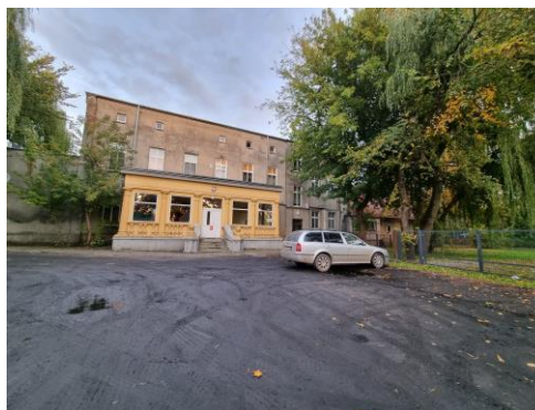
Fotografia 16. Widok na dwór w Jaksicach.

Budynek objęty ochroną poprzez wpis do wojewódzkiej ewidencji zabytków. Stan techniczny obiektu – dobry. Budynek wskazany do kompleksowego remontu konserwatorskiego.