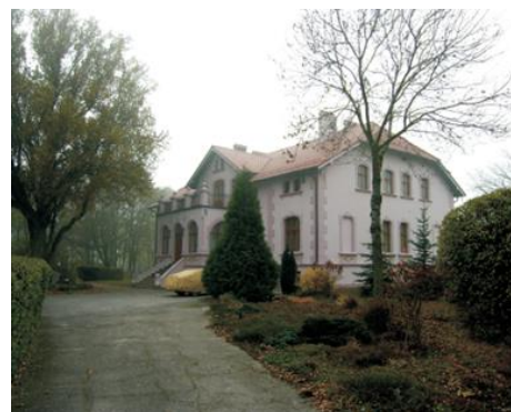
Fotografia 7. Widok na dwór w Kruśliwcu.

Dwór powstał około 1900 r. dla Augusta Otto i jego żony Amalii Herminy z domu Koch. W 1991 r. zrujnowany dwór wraz z parkiem nabyli obecni właściciele. Dwór w stylu historyzmu, piętrowy z mieszkalnym poddaszem, wzniesiony na planie prostokąta, nakryty czterospadowym dachem, zwrócony frontem ku wschodowi. Elewacje są wzbogacone urozmaiconymi podziałami architektonicznymi i dekoracją sztukatorską. Elewację frontową opina masywna weranda z tarasem z dekoracyjną balustradą, poprzedzona ujętymi litą balustradą schodkami podejścia; w elewacji tylnej wydatny ryzalit. Wewnątrz zachowane fragmenty malowideł z pocz. XX w. Obiekt znajduje się w rękach prywatnych. Założenie dworsko-parkowe wpisano do rejestru zabytków pod nr.: A/1456 z 26.04.1984 r. Stan zachowania dworu dobry.