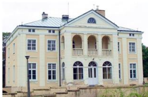
Fotografia 12. Widok na dwór w Piotrowicach.

Dwór powstał w końcu XIX w. na niewielkim wzniesieniu, na wschodnim brzegu jeziora Piotrowskiego. Obiekt neoklasycystyczny, piętrowy, na planie prostokąta, z użytkowym poddaszem, kryty czterospadowym dachem. W fasadzie znajduje się ryzalit zwieńczony trójkątnym frontonem z oculusem. Elewacje zachodnia i północna