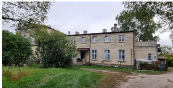
Fotografia 19. Widok na dwór w Kruszy Zamkowej.

Wzniesiony około 1870 r. dla rodziny Nehringów. Dwór pozbawiony cech stylowych, piętrowy, o gładkich ścianach, z reliktem gzymsu kordonowego i trójkątnym szczytem, w którym oculus. W otoczeniu dworu, park z około połowy XIX w., z drzewostanem i relikdami cmentarza niemieckich właścicieli dworu.