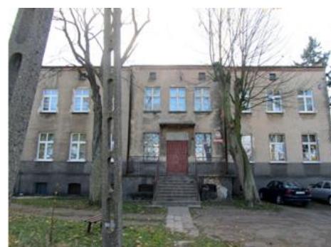
Fotografia 24. Widok na dwór w Słońsku.

Park z około połowy XIX. o powierzchni około 0,5 ha. Stan techniczny obiektu – dostateczny. Budynek objęty ochroną poprzez wpis do wojewódzkiej ewidencji zabytków.