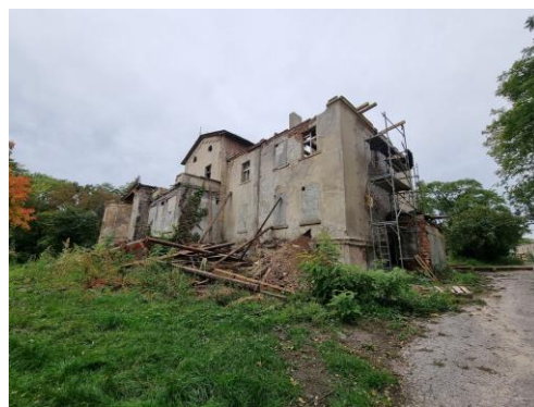
Fotografia 5. Widok na dwór w Gnojnie.

Pierwotnie eklektyczny, obiekt o urozmaiconej bryle z wyższą częścią środkową, nakrytą dachem dwuspadowym, flankowaną przez niższe, piętrowe skrzydła kryte dachami płaskimi. Od strony parku ryzalit poprzedzony murowaną werandą z zejściem do parku z relikdami murowanej, płycinowej balustrady tarasu. W zachodniej części elewacji tylnej znajduje się zaokrąglony na narożach wykusz z gierowanymi, masywnymi gzymsami. W skrzydle zachodnim wydzielona klatka schodowa. Dwór otoczony od strony zachodniej i południowej parkiem krajobrazowym ze stawem pośrodku, a od północy zabudowaniami gospodarczymi. Założenie dworsko-parkowe wpisane do rejestru zabytków pod nr.: A/1455 z 26.04.1984 r. Obiekt znajduje się w rękach prywatnych. Stan techniczny dworu bardzo zły, budynek nie użytkowany w stanie destrukcji, otwory w budynku zamurowane. Na dzień sporządzania dokumentu podjęto działania związane z renowacją obiektu.