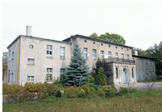
Fotografia 20. Dwór w Pławinie.

Powstał na przełomie XIX i XX w. dla rodziny Schreiberów. Piętrowy z skrzydłami po bokach, poprzedzony, murowanym gankiem, nad którym taras. Mocno przebudowany po 1945 r. utracił cechy stylowe. We wnętrzach zachowana oryginalna stolarka schodów.