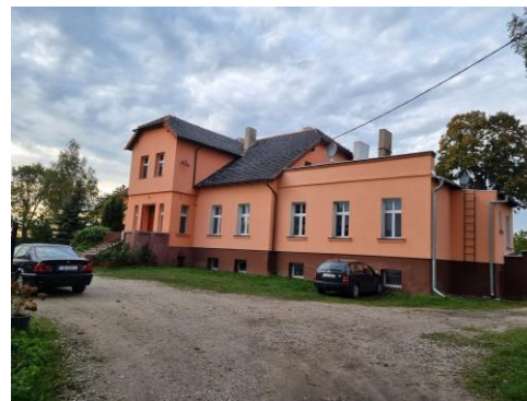
Fotografia 25. Widok na dwór w Sójkowie.

Dwór wzniesiono w 2. połowie XIX w. Po rozwiązaniu PGR-ów w 1996 r. w budynku utworzono mieszkania. Dwór jest parterową budowlą z masywnym, piętrowym ryzalitem, nakrytą dwuspadowym dachem, z wystawką ryzalitu nakrytą dachem naczółkowym. Ryzalit w przyziemiu z wejściem do wnętrza poprzedzonym tarasem i masywnymi schodami. Od strony wschodniej budynek poszerzony jest o przybudówkę i pozbawiony pierwotnych podziałów i detalu architektonicznego z wymienioną stolarką okienną na współczesne okna z PCV. Wokół dworu pozostałości parku z 2. poł. XIX w. o powierzchni około 2 ha. Obecnie wewnątrz parku zaniedbane z pojedynczymi drzewami i szpalerami drzew na jego obrzeżach. Z kilku rosnących wcześniej w parku pomników przyrody zachował się wiąz szypułkowy. Stan techniczny obiektu – dobry. Budynek objęty ochroną poprzez wpis do wojewódzkiej ewidencji zabytków.