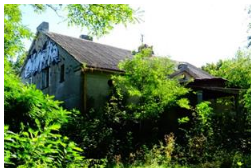
Fotografia 21. Dwór w Pławinku.

Wybudowany w 2. połowie XIX w. dla rodziny Łyskowskich. Dwór w stylu polskim, parterowy, poprzedzony gankiem wspartym na czterech kolumnach, zwieńczonym trójkątnym szczytem. Budynek w bardzo złym stanie technicznym. Od południowego zachodu park krajobrazowy o powierzchni 1,5 ha ze stawem. Obiekt znajduje się w rękach prywatnych.