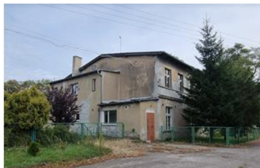
Fotografia 26. Widok na dwór w Trzaskach.

Stan zachowania – zły. Wskazane odtworzenie pierwotnej struktury budynku z podziałami architektonicznymi i stolarką, nawiązującą do historycznych konstrukcji stolarek. Budynek objęty ochroną poprzez wpis do wojewódzkiej ewidencji zabytków.