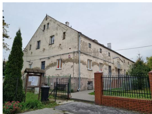
Fotografia 8. Widok na dwór w Latkowie.

Dwór wzniesiono w 1. połowie XIX w., zapewne dla rodziny von Busse. W XIX w. majątek należał do Artura von Busse, potem Ernsta Hugona Busse i kolejnych spadkobierców. Po 1945 r. zaadaptowano go na mieszkania. Dwór pozbawiony cech stylowych jest budowlą parterową, z użytkowym poddaszem i piwnicami w typie suterren, nakrytą