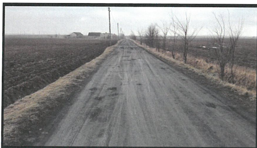
Stan nawierzchni drogi wewnętrznej przed przebudową

Droga posiada nawierzchnię z mieszanki żuźla i kruszywa łamanego o zmiennej szerokości, około 4,0 - 5,0 m. Warstwa istniejącej nawierzchni jest zabłocona i zabrudzona przez pojazdy rolnicze wyjeżdżające z pól. W nawierzchni występują ubytki głębokości kilkunastu centymetrów. Wzdłuż drogi występują po prawej stronie pola uprawne, po lewej stronie posesje z zabudową zagrodową. Nie występuje oznakowanie pionowe i poziome drogi.